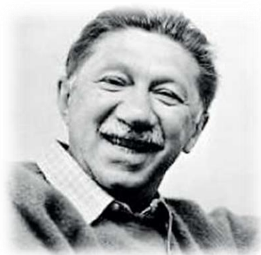
Abraham Maslow (1908年～1970 年)

人間は、それぞれ人間とあいて持っているなんらかの 欲求を満たしたいために、働いている。